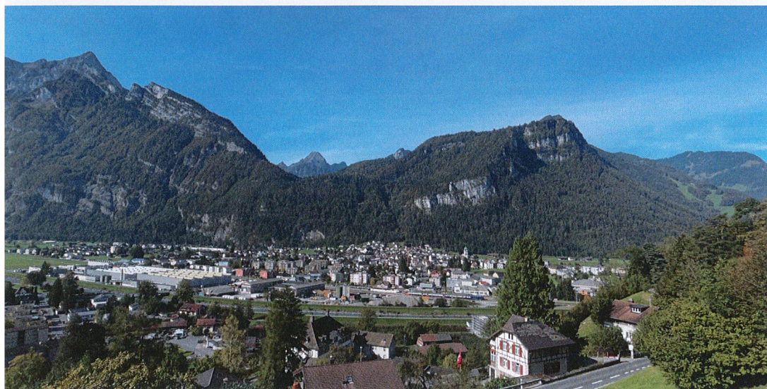
Näfels mit dem dahinterliegenden Niederberg