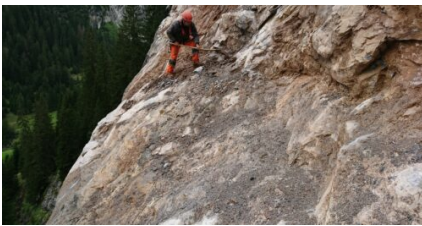
Kontrolle Felswand und Begleitung Felsräumung nach erfolgreicher Sprengung