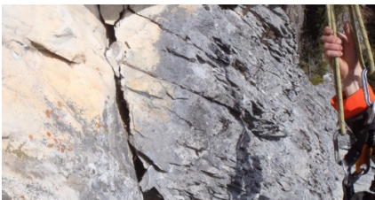
Beurteilung absturzgefährdeter Felspakete am hängenden Seil