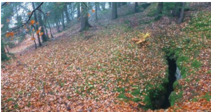
Kartierung der Phänomene (Beispiel Felsspalt) im Ausbruchgebiet.